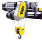
Tecle electrico cadena cpe