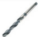
Jgo broca cilíndrica metal