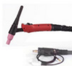
Cuerpo torcha tig-arco: mw